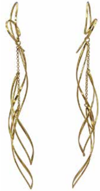
GD-3051 K18 W12mm×H80mm