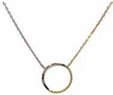
GD-8007 K18/Pt900 H13mm×W13mm