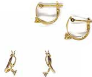
GD-3067 K18/Dia 1/70×2 H11mm×W5mm