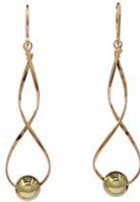
GGF-5031 14KGF(YG&PG) H52mm×W13mm