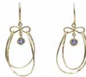
GD-3022K10-TZ K10YG/タンザナイト3mmRD H38mm×W16mm