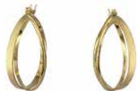
GD-3058 K18 W9mm × H21mm