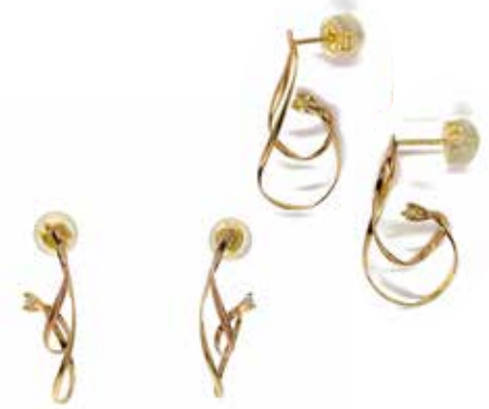
GD-3068 K18(YG&PG)/Dia 1/100×2 H22mm×W7mm