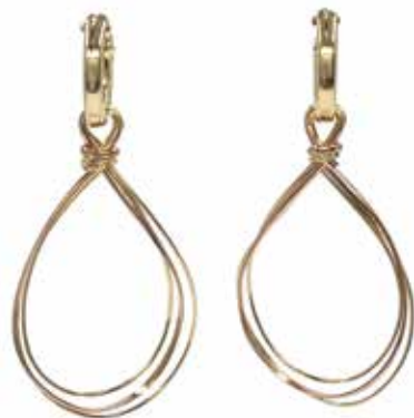
GGF-5024 14KGF(YG&PG) H48mm×W22mm