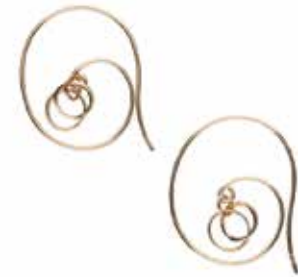
GD-3109 K18 or K10 W3mm×H19mm