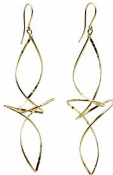
GGF-5003 14KGF W26mm × H71mm