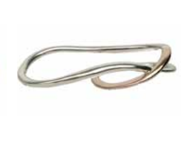
GSVK-2004PG SV925/K10YG (free)