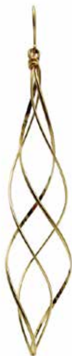
GGF-5002 14KGF W18mm × H93mm