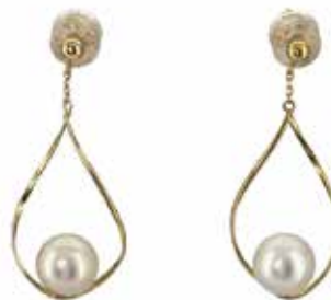
GD-3059 K18/アコヤパール φ7-8 W14mm × H32mm