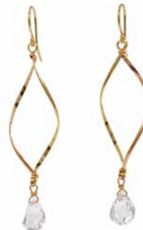
GGF-5029 14KGF(YG&PG)/クォーツ H60mm×W14mm