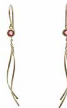
GD-3025K10-PT K10YG/ピンクトルマリン3mmRD H45mm×W4mm