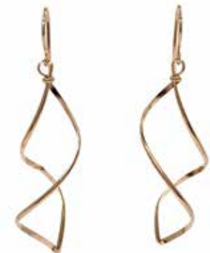
GGF-5035 14KGF(PG) H47mm×W14mm