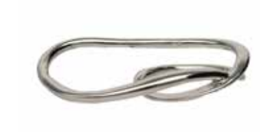
GSV-6020 SV925 (ロジウムメッキ) (free size)