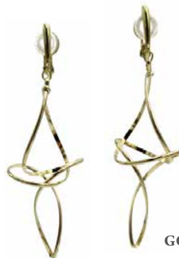
GGF-5008EG 14KGF W9mm × H62mm