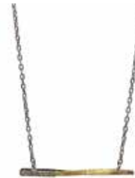
GD-8009 K18/Pt900/Dia 0.03ct H1.3mm×W22mm