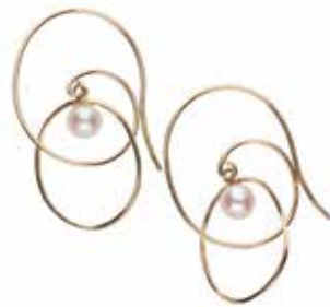
GD-3108 K18 or K10 W12mm×H26.5mm/淡水パールφ4.0