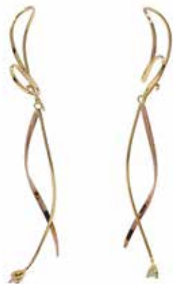
GD-3069 K18(YG&PG)/Dia 1/100×2 H52mm×W8mm