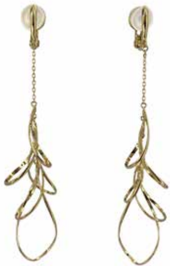
GD-3055EG K18 W13mm × H67mm