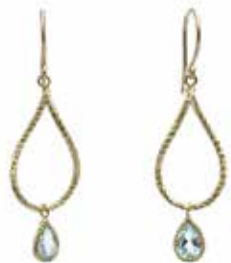
GD-3020K10-BT K10YG/スカイブルトバ4×6PS H30mm×W10mm