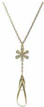
GD-8002 Dia :0.12ct TOP:W7mm×H32mm 全長45cm スライドAJ