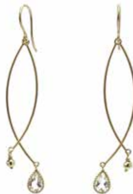
GD-3024K10-BM K10YG/ブルームーン4×6PS H50mm×W9mm