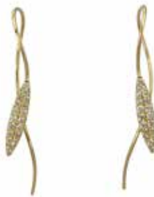
GD-3053 K18/Dia 0.13ct×2 W6mm×H36mm