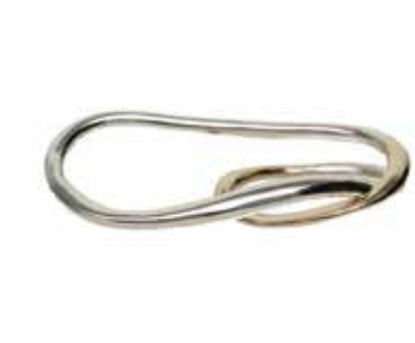
GSVK-2004YG SV925/K10YG (free)