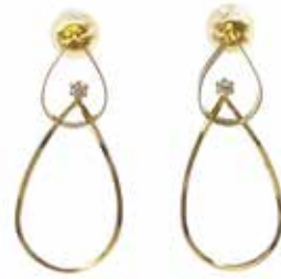
GD-3063 K18/Dia 1/30×2 H28mm×W12mm