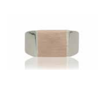
GSVK-2003PG SV925/K10YG 画像は#16 (#9～19可)