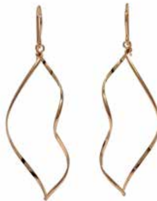
GGF-5034 14KGF(PG) H51mm×W16mm