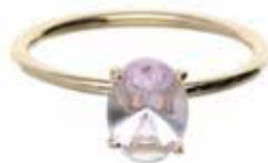
GD-6050AM-tate K10orK18 ニューエラカット0V6*8アメジスト 画像は#12（#8～16可）