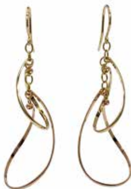
GGF-5027 14KGF(YG&PG) H50mm×W18mm