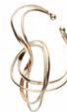
GD-3114EC K18 or K10 W13.5mm×H28mm