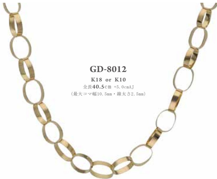
GD-8012 K18 or K10 全長 40.5cm +5.0cmAJ (最大コマ幅10.5mm・線太さ2.5mm)