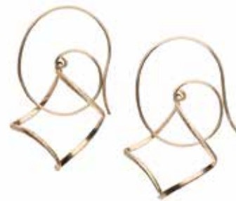
GD-3111 K18 or K10 W16mm×H31mm