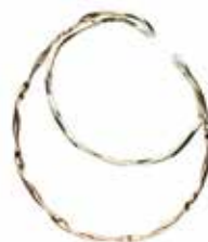
GD-3109EC K18 or K10YG/WG W8mm×H28mm