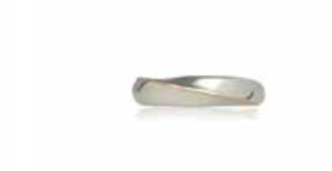
GSVK-2001PG SV925/K18PG 画像は#12.5 (#9～19可)