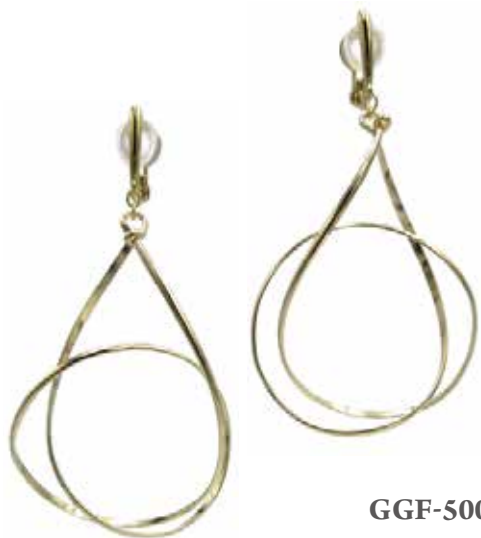
GGF-5006EG 14KGF W30mm × H58mm