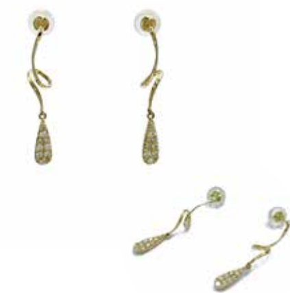
GD-3029 Dia :0.20ct W4mm×H28mm