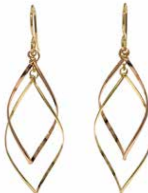
GGF-5028 14KGF(YG&PG) H51mm×W16mm