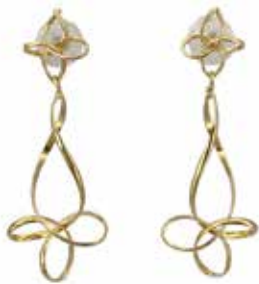
GD-3052 K18 W13mm×H36mm