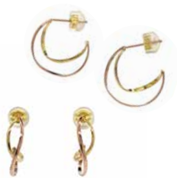
GD-3071 K18(YG&PG) H16mm×W4.5mm