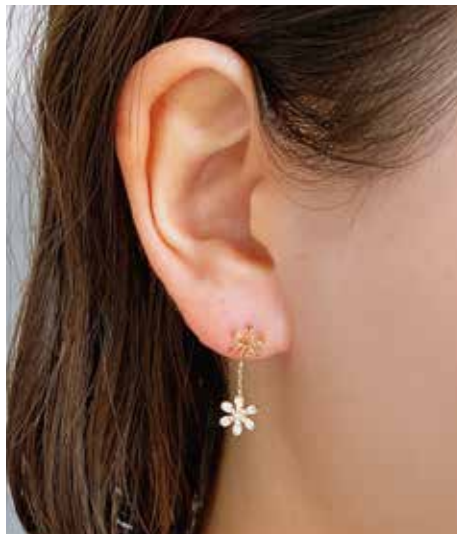
GD-3031 Dia :0.24ct W7mm×H22mm