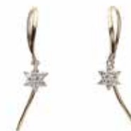
GD-3117 K18/Pt900 or ALLK18 W4.5mm×H23mm/Diamond:0.07ct×2