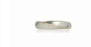
GSVK-2001YG SV925/K18YG 画像は#12.5 (#9～19可)