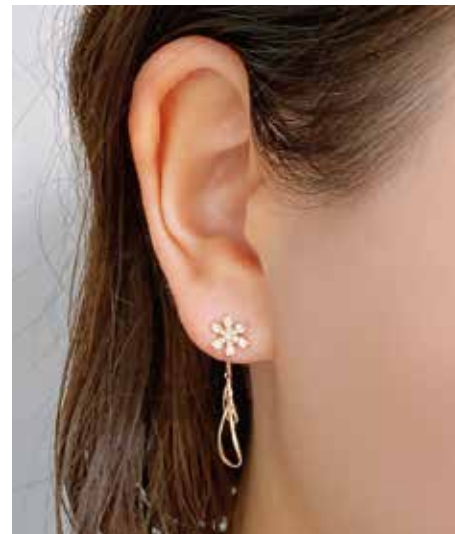
GD-3032 Dia :0.24ct W7mm×H32mm