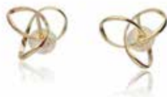
GD-3122 K18 or K10 W11.5mm×H13mm