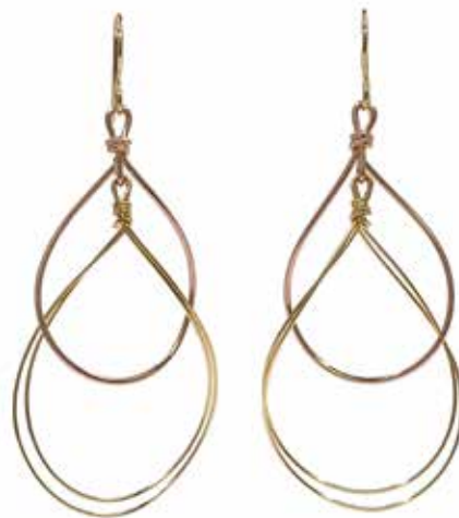
GGF-5025 14KGF(YG&PG) H61mm×W24mm