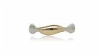
GSVK-2000 SV925/K10YG 画像は#13 (#11～14可)