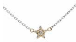
GD-8016 K18/Pt850 Dia:0.05ct 全長40cm(内3cmアジャカン)