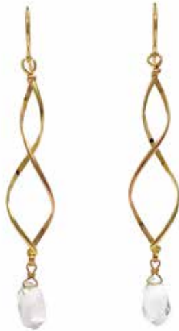
GGF-5030 14KGF(YG&PG)/クオーツ H62mm×W10mm