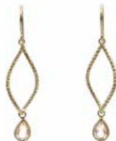
GD-3021K10-RQ K10YG/ローズクォーツ4×6PS H36mm×W9mm