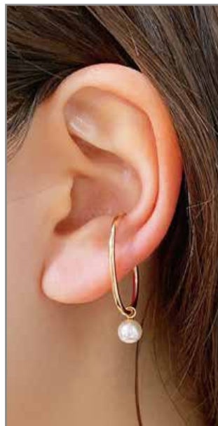
GGF-5014EC K14GF/ガラスパールφ6mm W6mm×H26mm×D19mm