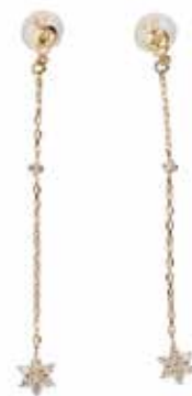
GD-3113 K18 or K10 W4.5mm×H46mm/Diamond:0.08ct×2 バックキャッチ