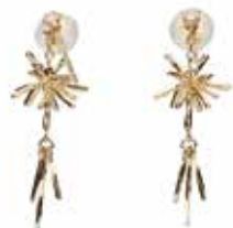
GD-3112 K18 or K10 W9mm×H26mm/Diamond:0.03ct×2