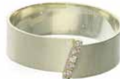
GD-6048 K10WG/K10YG K10orK18 Dia:0.03ct 画像は#12.5（#8～16可）