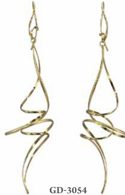
GD-3054 K18 W20mm×H81mm