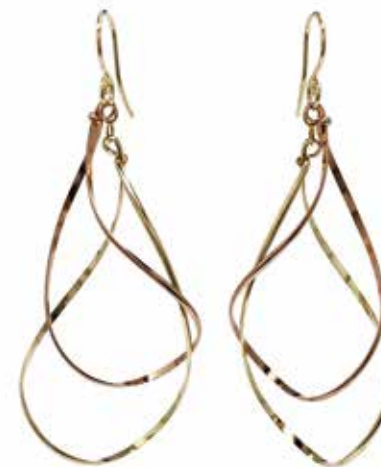
GGF-5026 14KGF(YG&PG) H60mm×W24mm