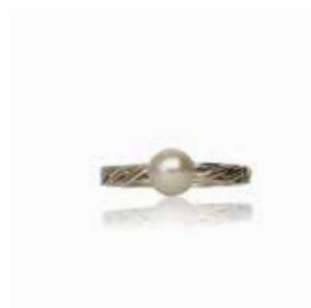
GSVK-2002 SV925/K10YG アコヤ φ 6.0mm 画像は#13 (#7～15可)