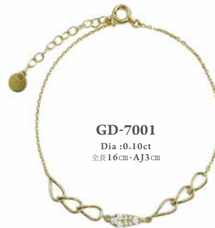
GD-7001 Dia :0.10ct 全長16cm+A3cm