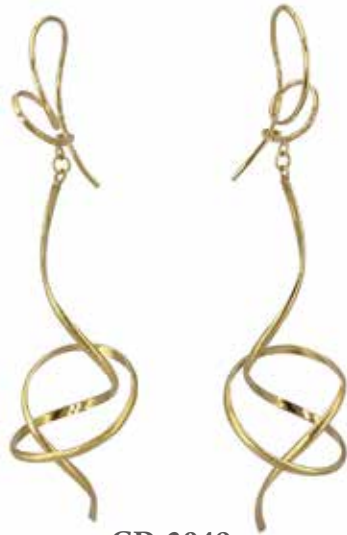
GD-3049 K18 W16mm×H67mm