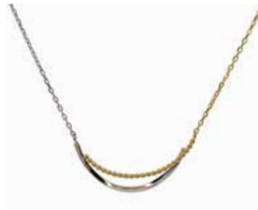
GD-8008 K18/Pt900 H10.5mm×W23mm