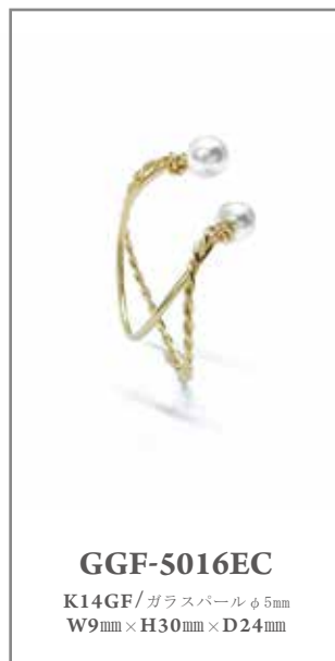
GGF-5016EC K14GF/ガラスパールφ5mm W9mm×H30mm×D24mm