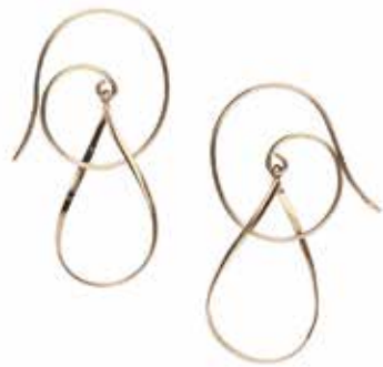
GD-3103 K18 or K10 W33mm×H13mm