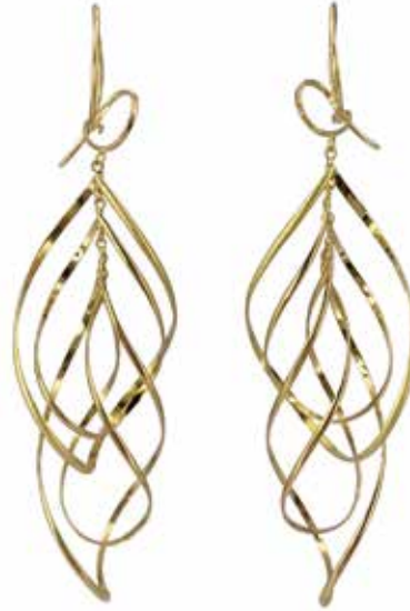
GD-3050 K18 W22mm×H71mm