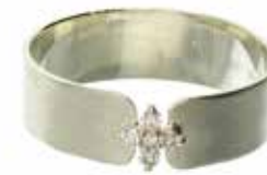
GD-6049 K10WG/K10YG K10orK18 Dia:0.06ct 画像は#11.5（#8～16可）