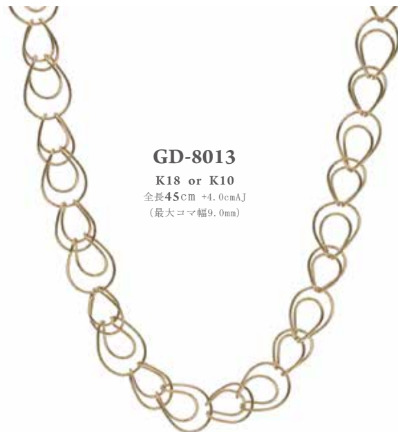
GD-8013 K18 or K10 全長 45cm +4.0cmAJ (最大コマ幅9.0mm)