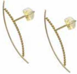
GD-3061 K18 H30.5mm×W2mm