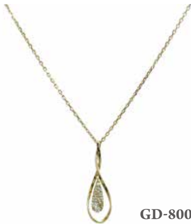
GD-8001 Dia :0.10ct TOP:W6mm×H20mm 全長45cmワンサイズ