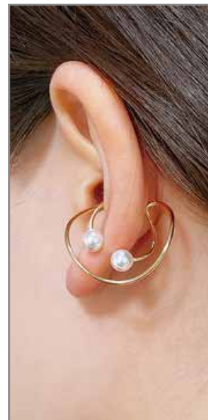
GGF-5015EC K14GF/ガラスパールφ5mm W6mm×H26mm×D24mm