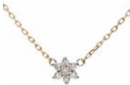
GD-8015 K18/Pt900 Dia:0.07ct 全長40cm(内3cmアジャカン)