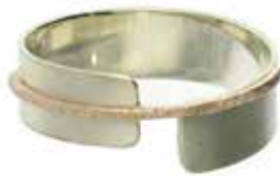
GD-6047 K10WG/K10YG K10orK18 画像は#13（#8～16可）