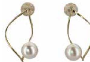
GD-3060 K18/アコヤパール φ7-8 W15mm × H24mm