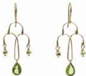
GD-3023K10-PE K10YG/ペリドット4×6PS H32mm×W12mm