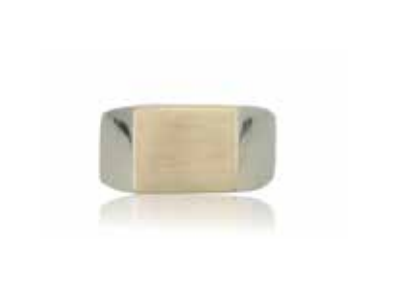
GSVK-2003YG SV925/K10YG 画像は#15 (#9～19可)