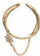
GD-3115EC K18 or K10 W6mm×H23mm/Diamond:0.07ct