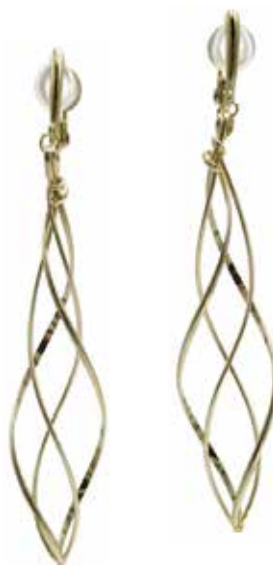
GGF-5007EG 14KGF W8mm × H69mm