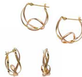
GD-3072 K18(YG&PG) H15.5mm×W6mm