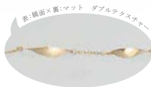
表:鏡面×裏:マット ダブルテクスチャー