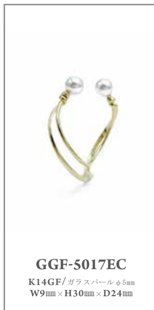
GGF-5017EC K14GF/ガラスパールφ5mm W9mm×H30mm×D24mm