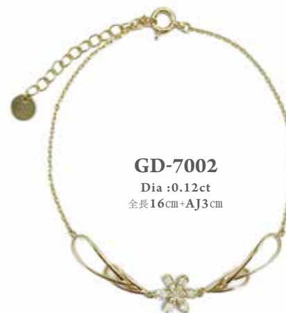
GD-7002 Dia :0.12ct 全長16cm+AJ3cm