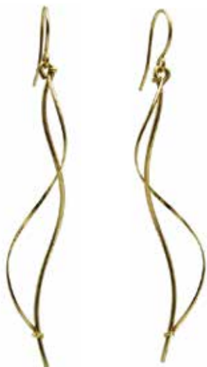
GGF-5000 14KGF W4mm × H69mm