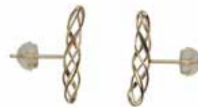
GD-3123 K18 or K10 W3mm×H18mm