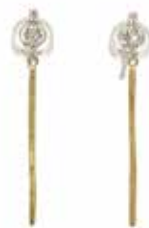
GD-3073 K18/Pt900/Dia 1/200×8 H28.5mm×W1.2mm