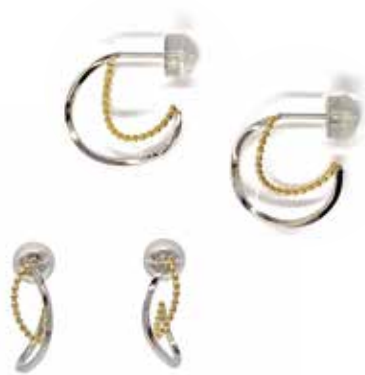
GD-3070 K18/Pt900 H15mm×W6mm