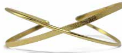
GD-7004 K18 W54mm×H46mm×D19mm