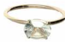
GD-6050GM-yoko K10orK18 ニューエラカット0V6*8グリーンアメジスト 画像は#11.5（#8～16可）