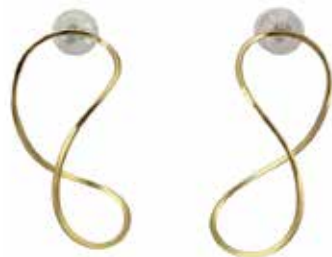
GD-3056 K18 W14mm × H29mm