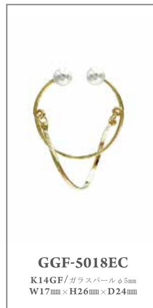
GGF-5018EC K14GF/ガラスパールφ5mm W17mm×H26mm×D24mm