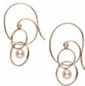
GD-3110 K18 or K10 W10.5mm×H28mm/淡水パールφ4.0