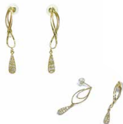
GD-3030 Dia :0.20ct W4mm×H28mm