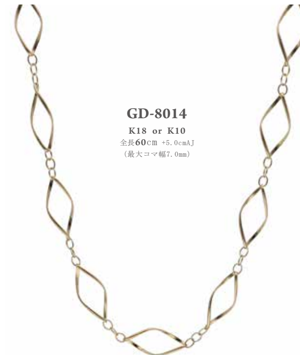
GD-8014 K18 or K10 全長 60cm +5.0cmAJ (最大コマ幅7.0mm)