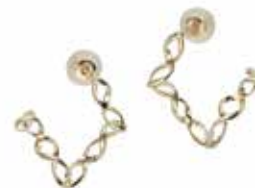
GD-3121 K18 or K10 W15.5mm×H17mm