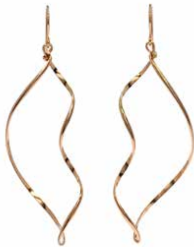
GGF-5033 14KGF(PG) H62mm×W20mm