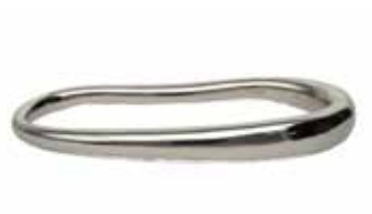
GSV-6019 SV925 (ロジウムメッキ) (free size)