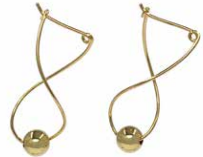
GGF-5032 14KGF H36mm×W12mm