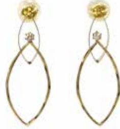
GD-3062 K18/Dia 1/30×2 H29mm×W11mm