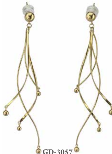
GD-3057 K18 W22mm × H75mm